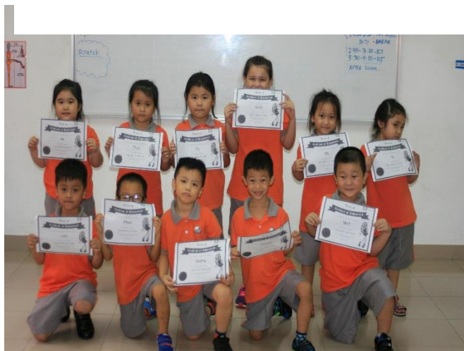
Ảnh trên: Lớp 1 Song ngữ nhận chứng nhận hoàn thành cấp độ 1 của ứng dụng Tynker