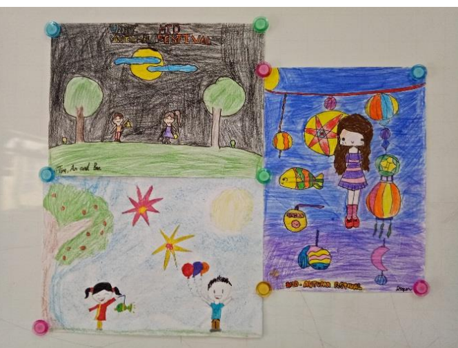
Ba tác phẩm chiến thắng của cuộc thi vẽ với chủ đề Tết Trung thu