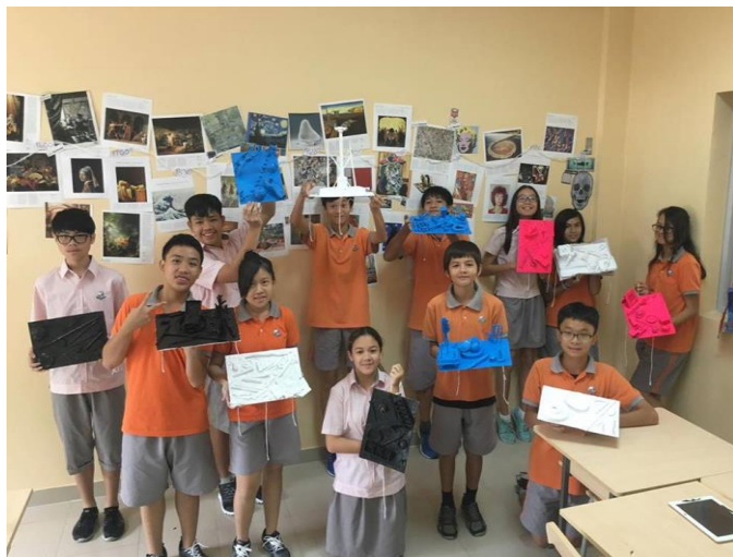
Ảnh trên: Lớp 8 quốc tế với bộ sưu tập đơn sắc trong dự án Mĩ thuật của mình