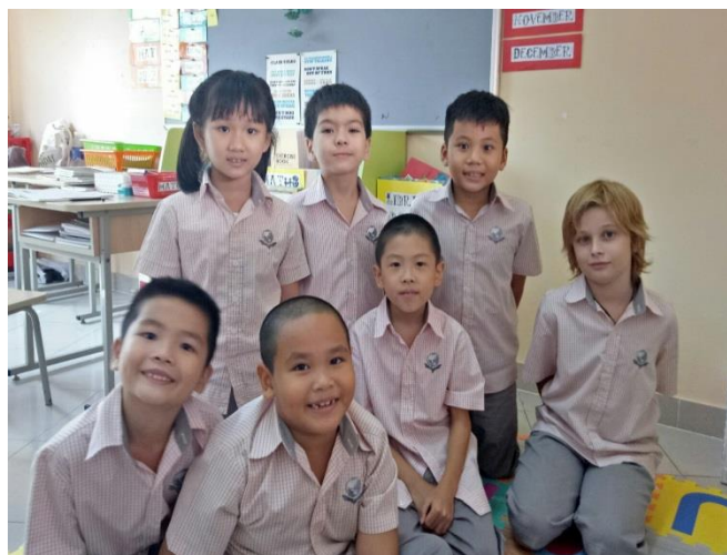
Ảnh trên: Lớp 1 và 2 Quốc Tế vui vẻ trong giờ sinh hoạt