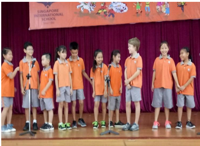
Ảnh trên: Lớp 3 Quốc Tế đang trình diễn trong buổi họp toàn trường