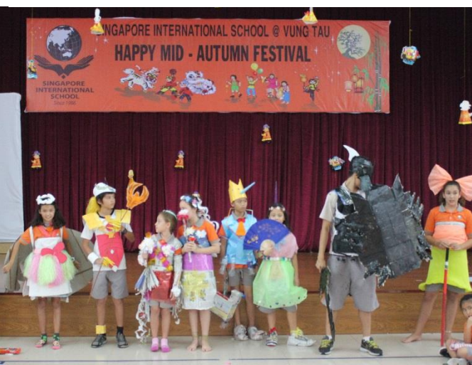
Ảnh trên: Tết Trung thu – Thời trang bằng vật liệu tái sử dụng