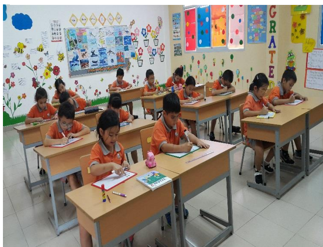
Ảnh trên: Lớp 2 Song ngữ các em rất chăm chỉ!