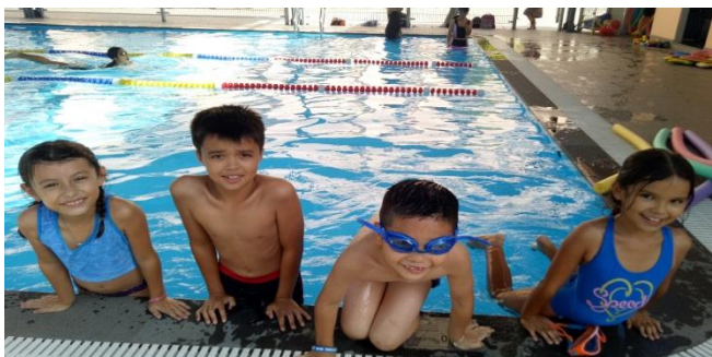
Ảnh trên: Các bạn học sinh tham gia lớp học bơi với tinh thần vui vẻ, phấn khởi