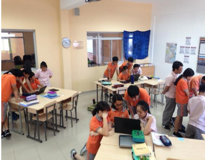
Ảnh trên: Lớp 8 Quốc tế luôn tập trung trong tiết học