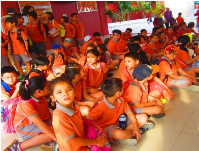
Ảnh trên: Các em học sinh đã sẵn sàng cho chuyến đi đến Vietopia