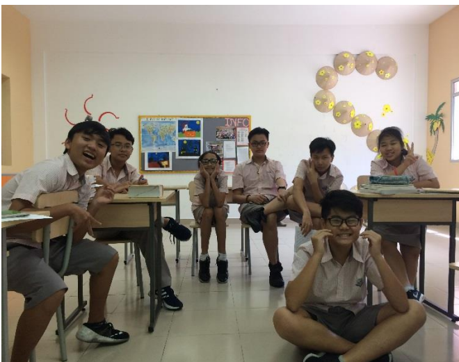
Ảnh trên: Lớp 8 và 9 Song ngữ luôn vui vẻ, hòa đồng với nhau