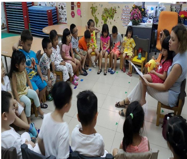
Ảnh trên: Phụ huynh đang đọc sách cho các bạn nhỏ