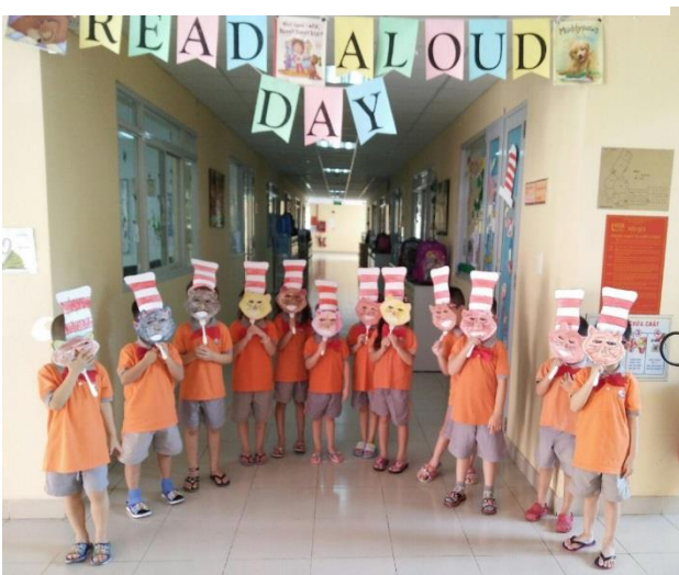
Ảnh trên: Các bạn thật ngộ nghĩnh với mặt nạ mèo trong ngày "Thế Giới Đọc Sách"