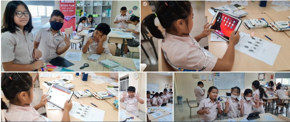
Các em học sinh lớp 4 tiến hành các thí nghiệm trong phòng STEM dựa trên dự án CREST AWARDS.