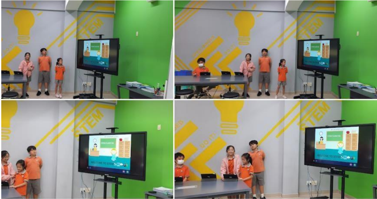
Bài thuyết trình STEM sử dụng iPad và bảng hiển thị tương tác INKNOE.

Các em học sinh tiểu học của chúng ta đang tìm hiểu và thử nghiệm các dự án STEM của CREST AWARDS, cũng như viết mã và thu thập dữ liệu. Chương trình CREST Awards cung cấp một loạt các hoạt động hấp dẫn cho học sinh và giới thiệu khoa học, công nghệ theo cách thực hành và dễ tiếp cận.