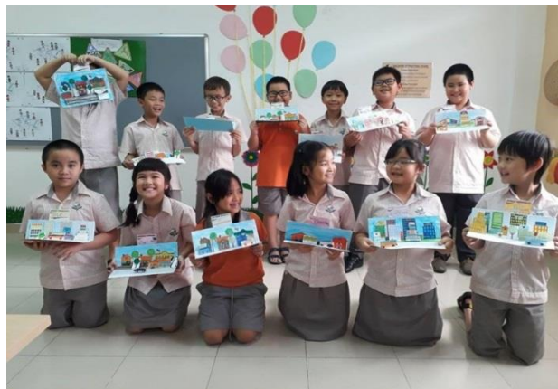
Ảnh dưới: Lớp 3G với những tác phẩm của mình