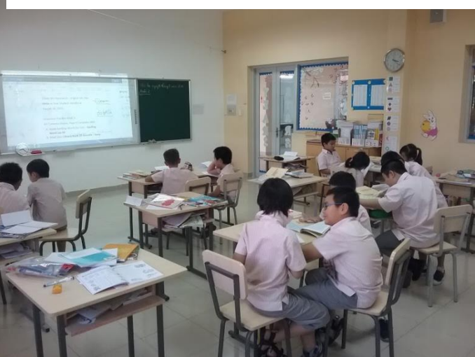
Ảnh trên: Học hỏi và thảo luận nhóm trong giờ Tiếng Anh