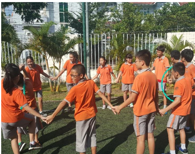
Ảnh trên: Các em học sinh lớn phải chuyền chiếc vòng đi xung quanh bạn mình mà không được buông tay đồng đội mình ra.