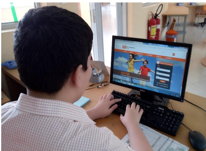
Ảnh trên: McOnline, một cách vui nhộn và hiệu quả giúp các em ôn lại kiến thức đã học trên lớp.