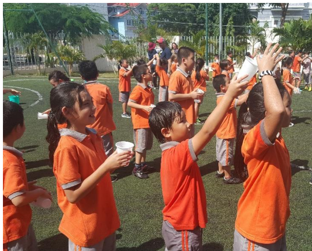
Ảnh trên: Đội Hydra khéo léo trong trò chơi Chuyền nước vào ngày cuối của học phần