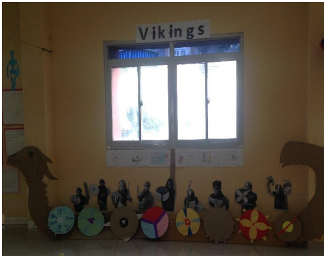
Ảnh trên: Con tàu Viking của các em học sinh lớp 4L trong môn Khoa học Xã Hội.