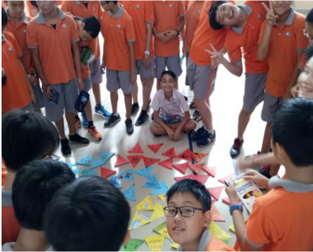
Ảnh trên: Thiết kế cờ trang trí cho căn-tin vào ngày cuối học phần 1