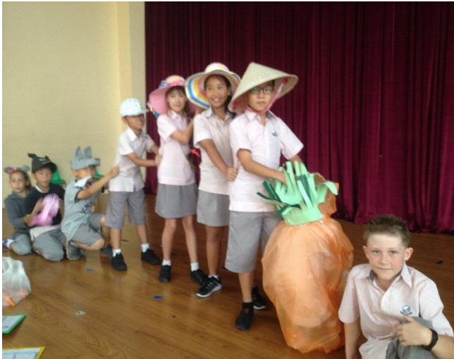
Ảnh trên: Lớp 4L với vở kịch 'Củ Cà Rốt Khổng Lồ'