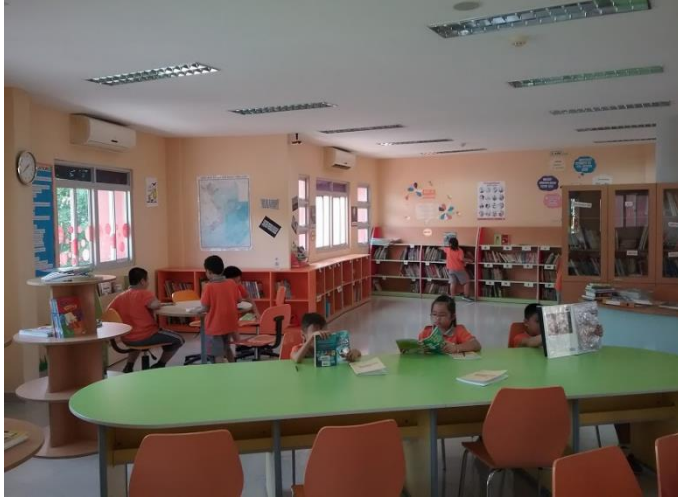
Ảnh trên: Lớp 3G dành thời gian đọc sách và cải thiện kỹ năng tiếng Anh của mình trong thư viện.