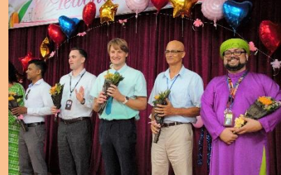
Ảnh trên: Ngày Nhà giáo Việt Nam Ảnh dưới: Hoạt động trong ngày Hội STEM kết hợp