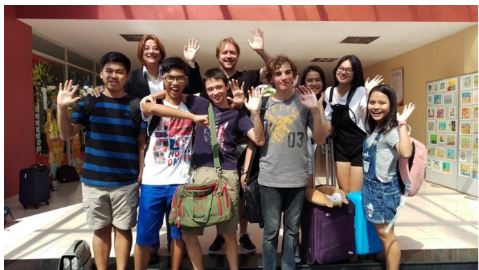
Ảnh trên: Bay tới Đà Nẵng thôi! Các em ngao du tới vùng đất mới cho Cuộc Thi Tìm hiểu về Kinh doanh. Các em thể hiện tinh thần rất tốt cũng như đã cho các bạn trường khác thấy rằng đội chúng ta mạnh như thế nào.