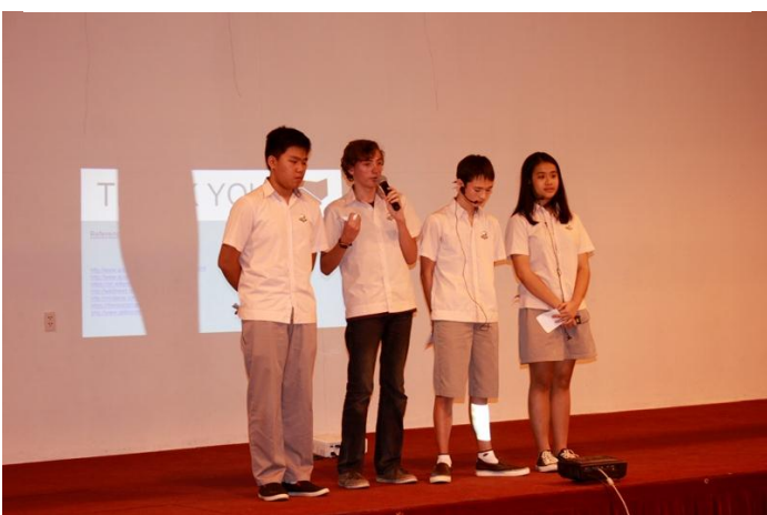
Ảnh trên: Đội Vũng Tàu thuyết trình rất chuyên nghiệp và nhận được sự hưởng ứng nhiệt tình. Toàn đội đã chiến thắng giải nhì!