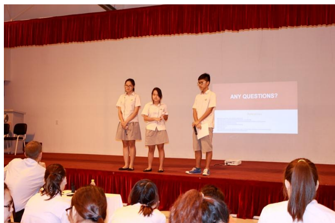
Ảnh trên: Nhóm thứ 2 của đội SIS Vũng Tàu cũng đã hoàn thành xuất sắc nhiệm vụ truyền đạt thông điệp trong phần thi thuyết trình của mình. Quán quân năm nay đã thuộc về Đà Nẵng. Các em học sinh cũng đã học hỏi lẫn nhau rất nhiều, cũng như biết cách động viên chính mình trong môi trường cạnh tranh khắc nghiệt.

Địa chỉ: Khu dân cư Đại An Phường 9, Tp Vũng Tàu Tỉnh Bà Rịa Vũng Tàu