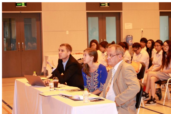
Ảnh trên: Sự hài lòng từ phía Ban giám khảo khi nghe các em thuyết trình. Các em đã đưa ra những câu trả lời rất thuyết phục và hiệu quả với một số câu hỏi khó.

Chúc mừng các em với một chuyến đi tuyệt vời. Cảm ơn sự hỗ trợ từ phía Quý Phụ huynh và đặc biệt cảm ơn đến đội chủ nhà SIS@ Đà Nẵng, đã sắp xếp cũng như cung cấp đầy đủ thông tin thú vị về kì nghỉ cuối tuần vừa qua cho các em.