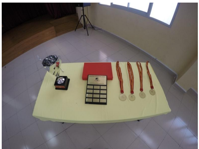
Ảnh trên: Bộ cúp và huy chương. Năm sau Vũng Tàu nhất định sẽ giành chiến thắng.