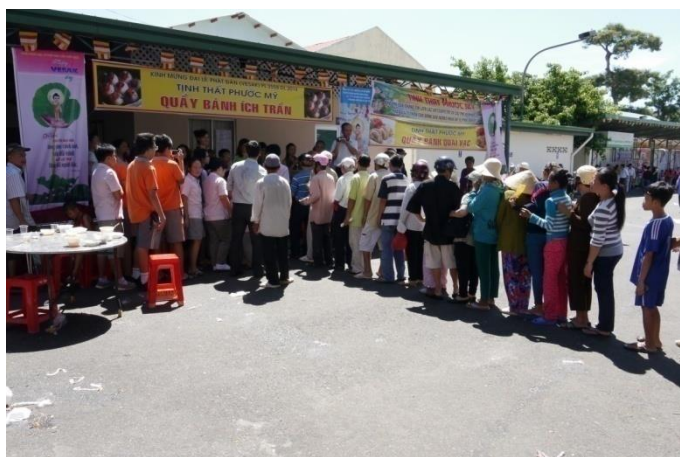
Ảnh trên : Hàng trăm người cảm kích trước hành động sự nhiệt tình và nỗ lực của học sinh trường chúng ta.