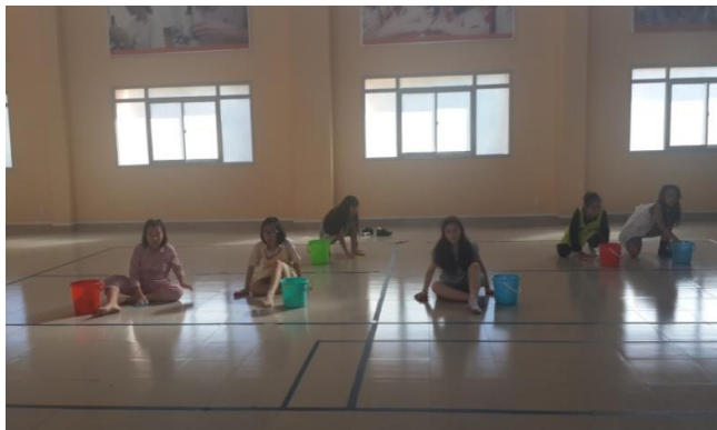
Ảnh trên: Các bạn nữ lớp 5 và 6 đang nỗ lực tập luyện cho tiết mục văn nghệ của mình trong Lễ Tốt Nghiệp.