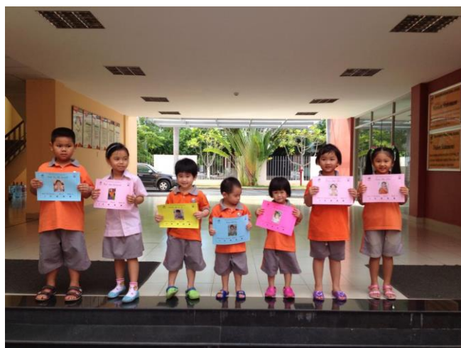
Hình ảnh trên và dưới đây: Những Siêu Sao của tuần.