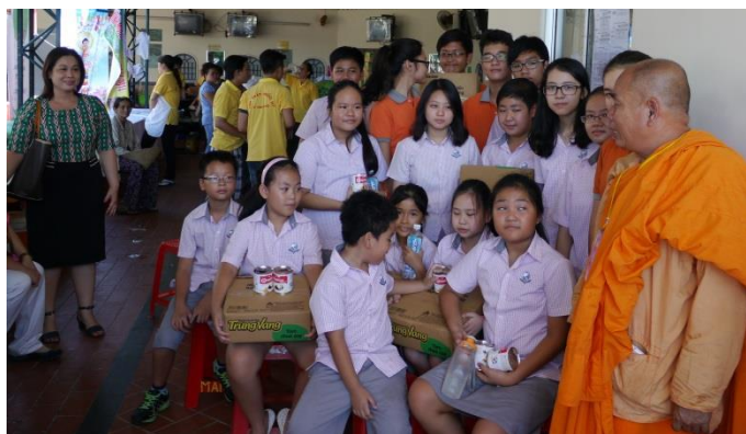
Ảnh trên: Một số học sinh của trường Quốc tế Singapore được hướng dẫn cách phát các phần quà.