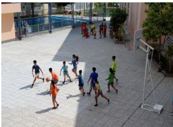
Ảnh trên: Nhóm Hydra và Dragon thi đấu Bóng rổ