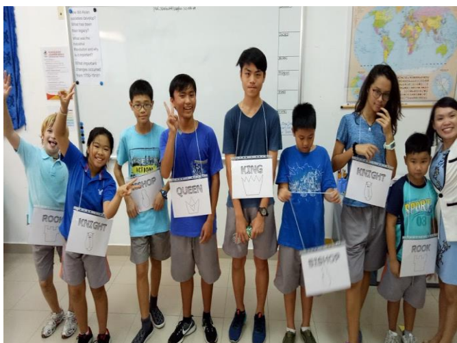
Ảnh trên: Đội Hydra sẵn sàng cho cuộc thi cờ vua