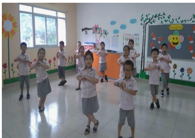
Ảnh trên: Học sinh lớp 1 song ngữ đang tập luyện cho tiết mục biểu diễn tốt nghiệp