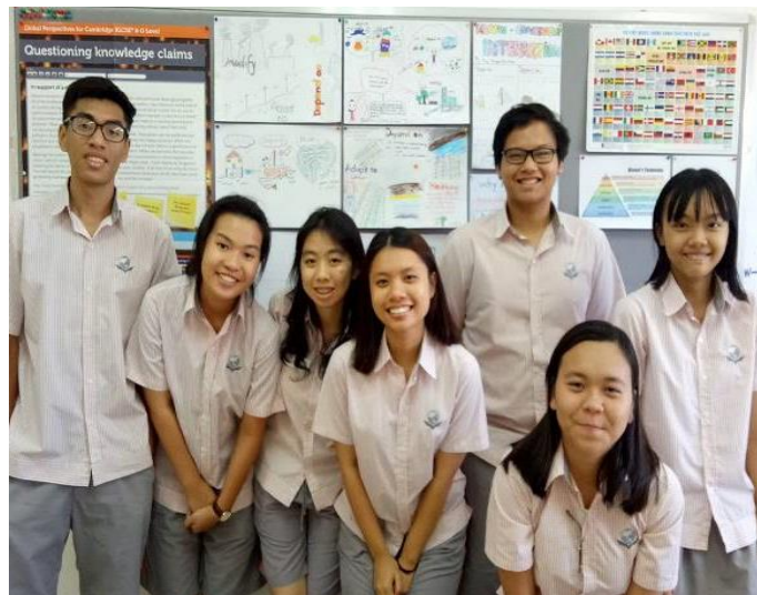
Ảnh trên: Học sinh lớp iGCSE1