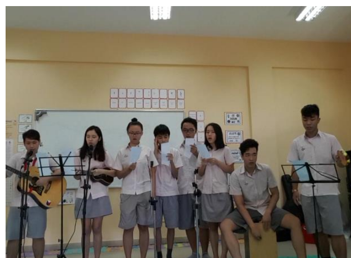
Ảnh trên: IGCS 2 đang luyện tập bài hát của mình cho chương trình ca nhạc.