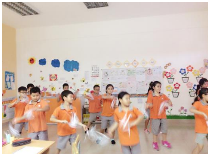
Ảnh trên: Học sinh lớp 2 song ngữ đang tập luyện cho tiết mục biểu diễn tốt nghiệp