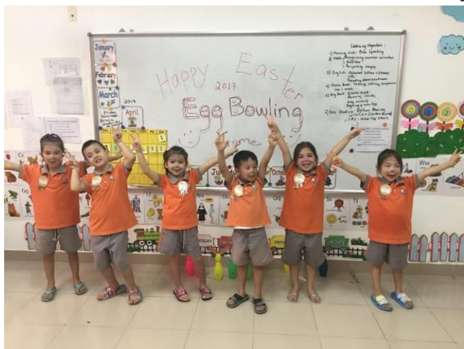
Ảnh trên: Khối Mẫu giáo đang hưởng ứng chương trình Lễ Phục Sinh