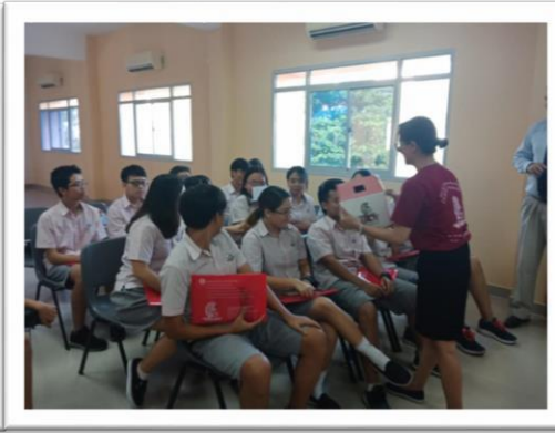
Chuyến thăm của Đại học Troy khiến học sinh thích thú.