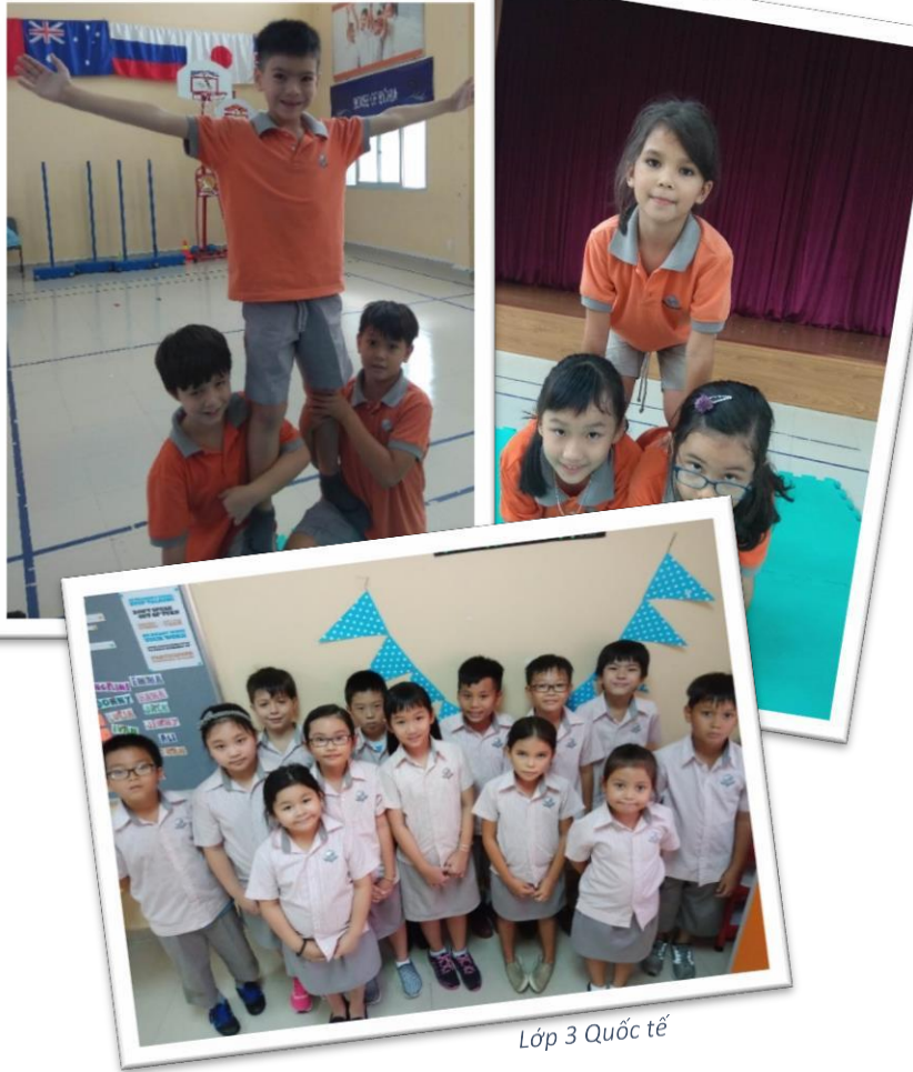
Lớp 3 Quốc tế