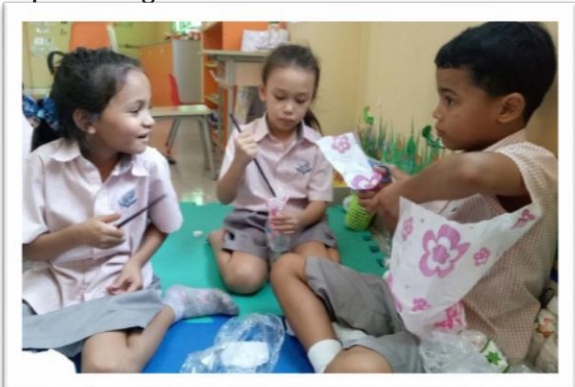
Tìm hiểu thêm về Gạch sinh thái trong báo tường