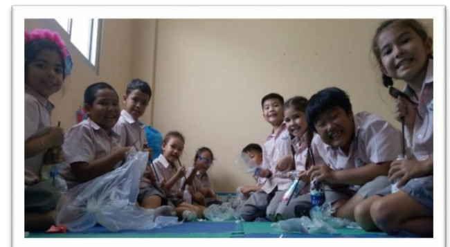
Lớp 1 và 2 Quốc tế đang làm Gạch sinh thái